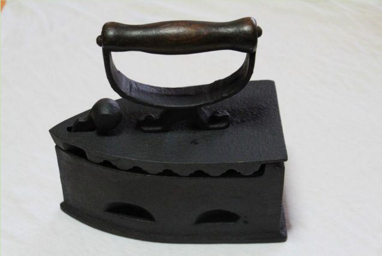
FERRO DE PASAR ou “plancha”